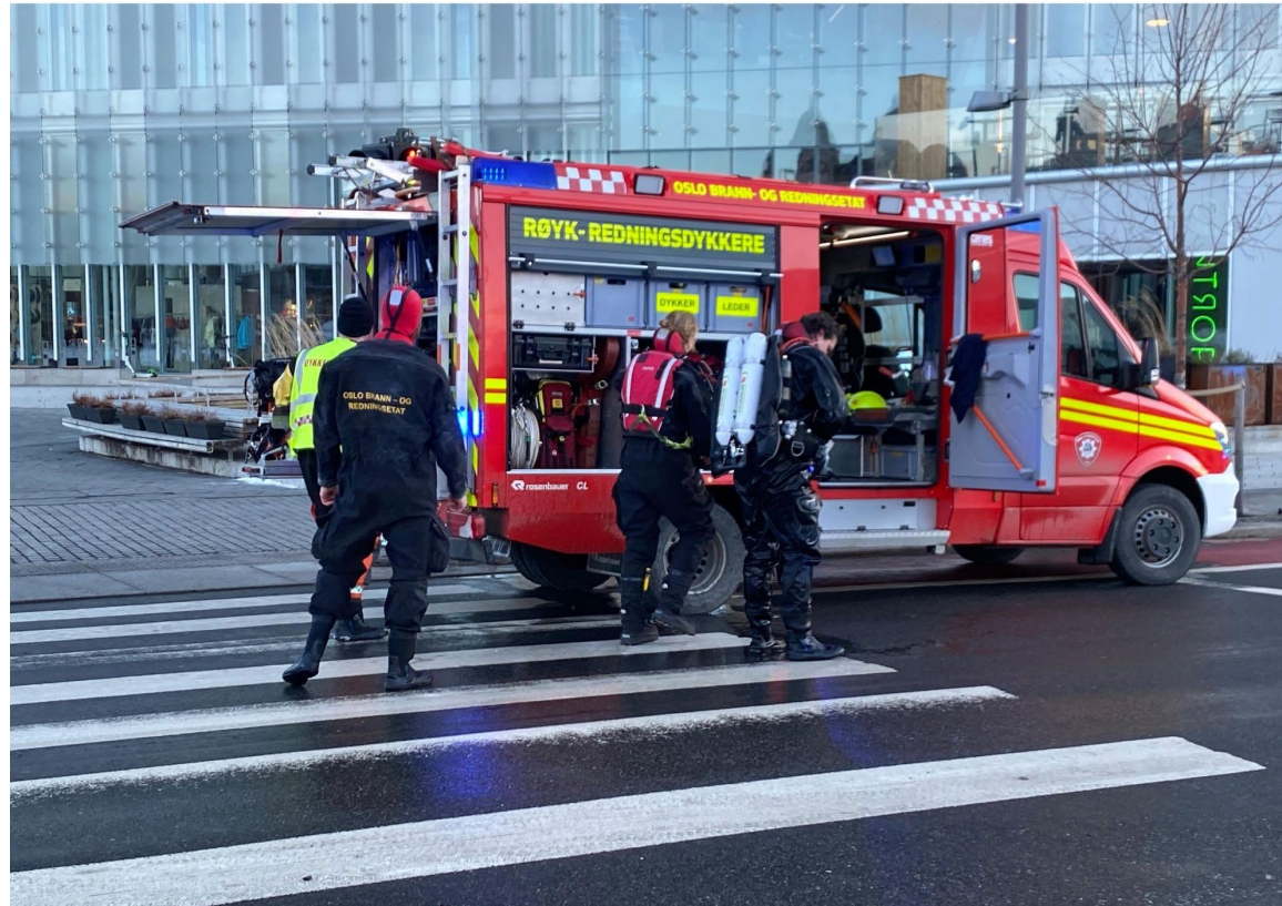
REDNINGSDYKKER-TJENESTER I NORGE

Hvilke ressurser til å søke under vann ankommer, og innenfor for hvilken tidsramme?